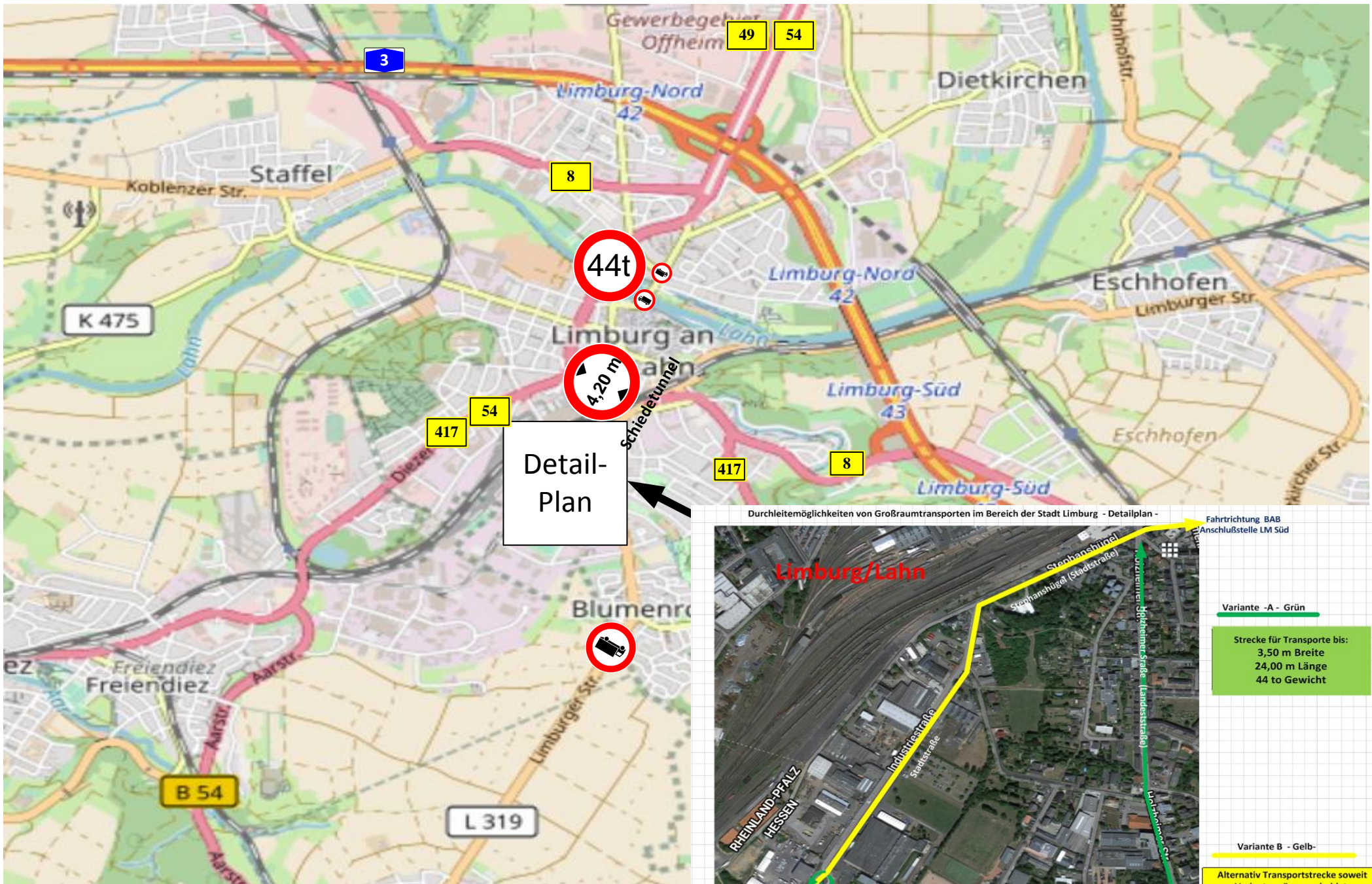
Durchleitmöglichkeiten von Großraumtransporten im Bereich der Stadt Limburg - Detailplan -